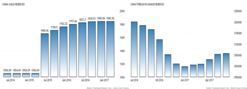
Дијаграм 2. Кинеске монетарне резерве: у злату и доларима 17