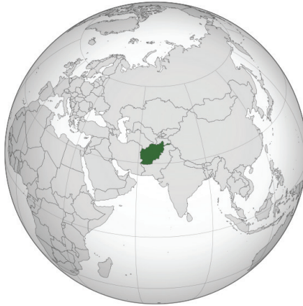
Карта 1: Географски положај Авганистана

септембра 2001. године, власти САД су фактички конструисале и повод за започињање операције Трајна слобода ( Operation Enduring Freedom ), у октобру исте године, а уз учешће још и савезничких војних снага. Сарадњом са снагама Уједињеног фронта Авганистана већ у децембру је срушена талибанска власт и формирано ново државно руководство са Хамидом Карзаијем на челу.