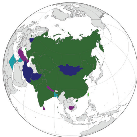
Карта 3: Шангајска организација за сарадњу

На самиту у Шангају 2001. године оснива се ШОС (Шангајска организација за сарадњу), чиме се процес трансформације завршава оснивањем нове међународне организације (у пуном смислу те речи, за заједничким секретаријатом, оснивачким актом и тд.). Тада је усвојена Декларација о оснивању Шангајске организације за сарадњу (оснивачки акт), донета Повеља ШОС (статутарни документ, којим се дефинишу разлози постојања, циљеви организације и начин функционисања) и потписана Шангајска конвенција о борби против тероризма, сепаратизма и екстремизма. Чланице ШОС заједнички утврђују тероризам, сепаратизам и екстремизам као претње како државама, тако и регионалној безбедности, а посебан акценат је стављен на сепаратизам, због чега се још једанпут нахлашава принцип неповредивости граница и гарантује територијални интегритет чланица 13 . Имајући у виду агресију на СР Југославију 1999. године и амбицију САД да прекрају границе суверених држава, ово је било од велике важности не само за Казахстан, Таџикистан и Киргизију, већ и за све остале државе у региону. Поред тога, за своје циљеве ШОС, поред наведених изазова, ризика и претњи који се тичу регионалне безбедности, проглашава још и „обезбеђивање услова за изградњу новог, демократског и праведног политичког и економског поретка“, као и „заједничко трагање за решењима за проблеме који се јављају у XXI веку“. 14