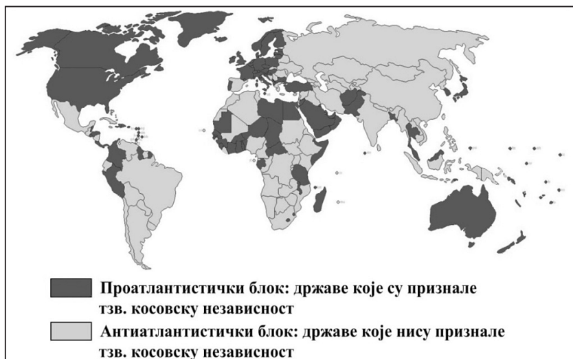
Карта 1: (Не)признавање тзв. косовске независности као индикатор необиполарног сврставања (стање средином 2018)

После три завршене и једне започете фазе током протекле деценије тзв. косовске независности (2008–2018), Косово и Метохија постају показатељ необиполарне поларизације као нове глобалне реалности (карта 1):