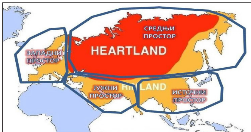
Слика 2: Ланац од три простора од значаја за очување америчке глобалне доминације након Хладног рата

Извор: Слика преузета и прерађена из: Zbignjev Bžežinski: Velika šahovska tabla , CID, Podgorica; Romanov, Banja Luka, 2001, стр. 37.